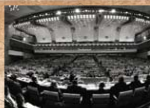
Conferencia Internacional sobre Atención Primaria de Salud, Alma-Ata, URSS, 1978

Finalmente, en febrero de 1970 fue elevada al Poder Ejecutivo el proyecto que luego se sancionó como Ley 18.610 de regulación de las Obras Sociales Sindicales y la creación del Instituto Nacional de Obras Sociales (INOS), que sería el encargado de la coordinación, planificación y control de la inversión de los recursos y del funcionamiento técnico-administrativo. La ley encomendó a las asociaciones